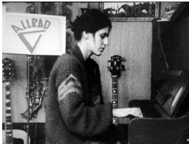
„Allrad e.V.“ (BRD 1980). Foto aus dem Film.

Kopie: Deutsche Kinemathek, Blu-ray, 54'